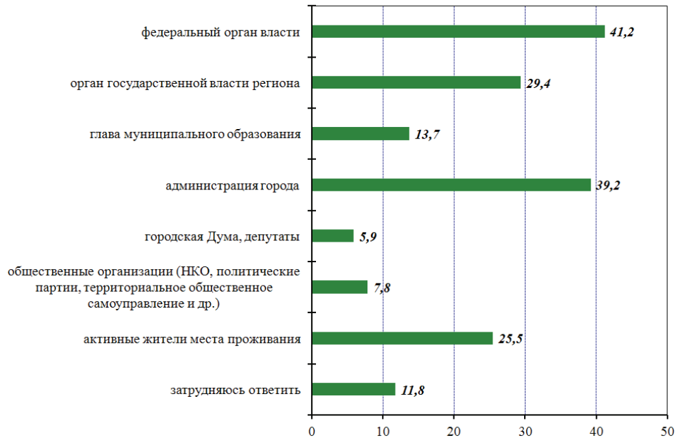
Рис. 3. Распределение ответов экспертов в 2010 г. на вопрос «Кому больше доверяет население?» (в процентах от числа ответивших, n = 274 )

тей укрепления доверия между жителями определенных территорий. Развитый уровень личного и особенно безличного доверия станет своеобразным драйвером, усиливающим защиту собственных социально-экономических интересов, или интересов своей социальной группы и, как следствие, источником успеха реформы местного самоуправления.