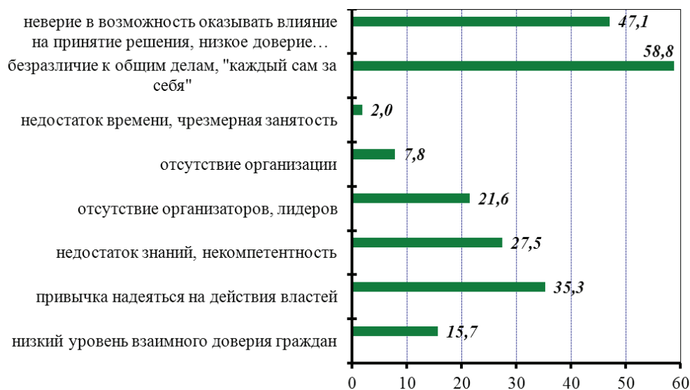
Рис. 2. Распределение ответов экспертов в 2010 г. на вопрос «Что, по Вашему мнению, чаще всего препятствует активному участию населения в работе общественных организаций, нацеленных на решение вопросов территории проживания?» (в процентах от числа ответивших, n = 274 )

В основном причинами низкой активности являются: безразличие к общим делам (так считают 58,8 % экспертов), неверие в возможность оказывать влияние на решения властей (мнение 47,1 % экспертов), привычка надеяться на действия властей (35,3 %) и др. (рис. 2). Также социальная активность напрямую зависит от таких показателей, как благополучие, защищенность и достижение социального успеха (снижение социальной депривации) [1, с. 142].